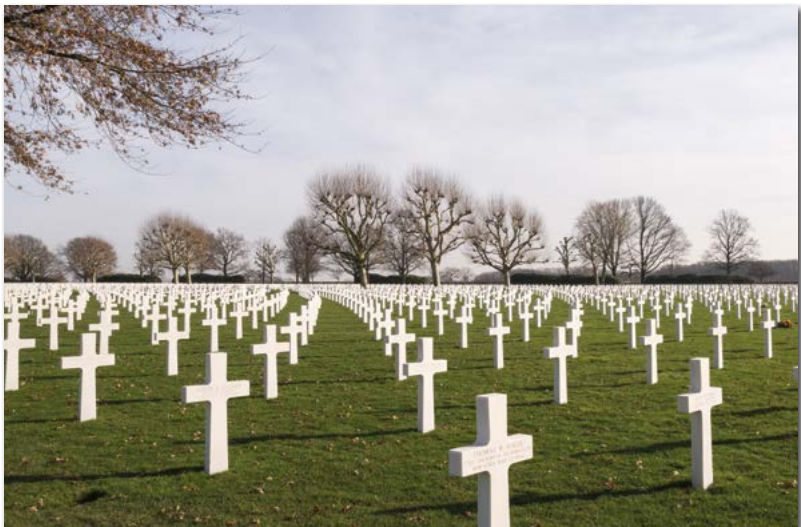
Amerikaanse Militaire Begraafplaats, Margraten

Ook in Voerendaal voelde men de behoefte om de herinnering levend te houden en ook hier verrezen diverse monumenten. Soms heel klein, soms iets groter. Het zijn echter allemaal stille getuigen van de verschrikkingen die onlosmakelijk aan een oorlog verbonden zijn. Gelukkig hebben de huidige generaties deze verschrikkingen niet aan den lijve hoeven te ervaren.