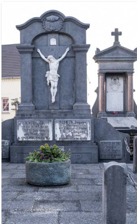
Graf fam. Jaspers