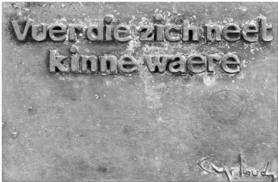
Vrijheidsmonument Vrijthof, Klimmen