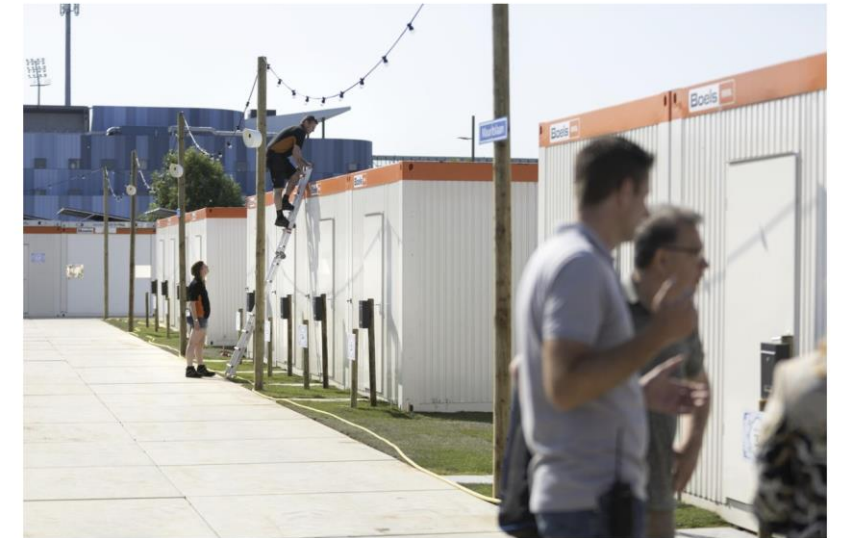
Kort na de opening in juni was er een open dag voor omwonenden van de crisisnoodopvang.

Drie maanden na opening nauwelijks klachten over crisisnoodopvang voor asielzoekers in Sittard