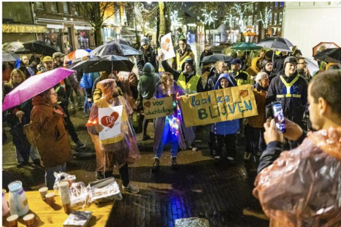
Een dikke honderd mensen hebben zich voor het raadhuis in Horst verzameld om zich uit te spreken voor opvang van asielzoekers.

Geen protest tegen, maar voor de opvang van asielzoekers in Horst: 'Alles beter dan deze mensen maar blijven rondpompen'