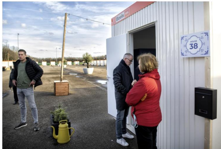
Omwonenden bezochten de noodopvanglocatie op Megaland vooraf tijdens een kijkdag.

Landgraaf en asielzoekers bewijzen ongelijk sceptici, opvang op Megaland zonder enige overlast verlopen: 'Zo kan het dus ook'