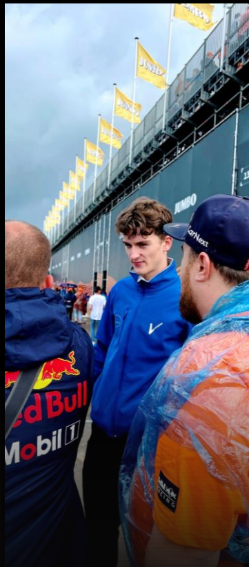
DUTCH GRAND PRIX